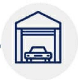
ГАРАЖ ИЛИ МАШИННОЕ МЕСТО

(не более 0,25 га общей площадью в городских или 1 га в сельских поселениях )